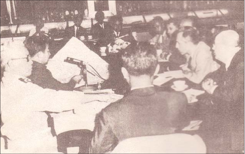
ស្តេចសីហនុកំពុងបង្ហាញផែនទីជំរកយៀកកុងនៅលើទឹកដីខ្មែរដល់ពួកអ្នកកាសែត (ថ្ងៃទី២៨ មិថុនា ១៩៦៩)

សីហនុពុំមែនមិនដឹងទេថា តាំងពីច្រើនឆ្នាំមកហើយ កងកម្លាំងយួនខាងជើង និងយៀកកុងបានមកតាំងនៅតាមផ្នែកទាំងឡាយ ដែលមិនសូវសំបូរប្រជាជនក្នុងរាជាណាចក្រ, នៅខេត្តនានាខាងភូមិភាគឦសាន ។ នៅខណៈដែលគាត់បានទទួលស្គាល់រដ្ឋាភិបាលឧទ្ទាម គឺរដ្ឋាភិបាលបដិវត្តន៍បណ្តោះអាសន្នយៀកកុង, សីហនុជំទាស់, ព្រមពេលគ្នានិងជាលើកទីមួយ, ដល់ការកាត់កាប់នៅលើផ្នែកមួយចំនួននៃខេត្តទាំងឡាយរបស់ខ្មែរ ដោយពួកកុម្មុយនិស្តយួន ។ ក្នុងសន្និសីទសារពត៌មានរបស់គាត់ នៅថ្ងៃទី១១ មិថុនា ១៩៦៩ សីហនុបានអះអាងថា ក្នុងខេត្តរតនគិរីដែល